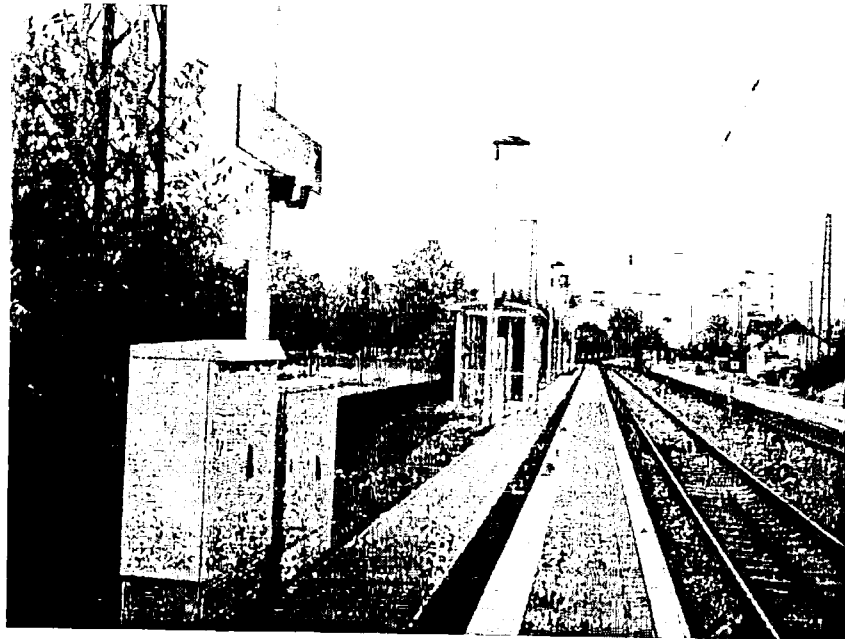
Lörrach-Haagen – fertiggestellter Bahnsteig 2